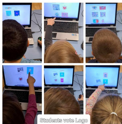
Votarea unui Logo pentru proiect