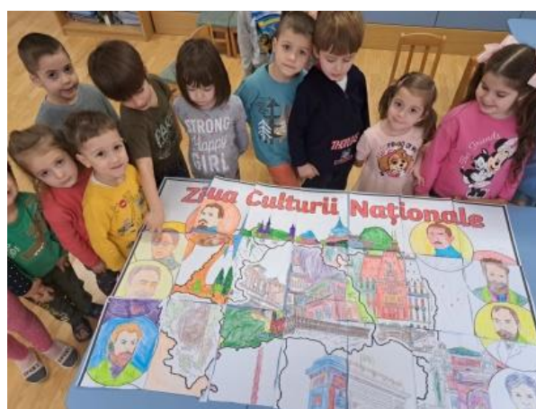
Realizarea unui poster pentru Ziua Culturii Naționale