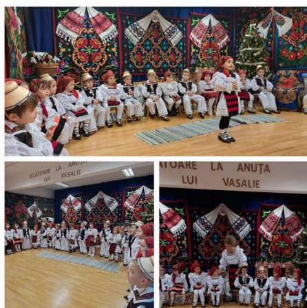
Prezentarea tradițiilor de sărbători

În cadrul activității „Zurnalist pentru o zi”, copiii fac o vizită la Muzeul de Mineralogie unde se documentează, obțin informații despre ce se află acolo, iar la întoarcere la grădiniță exprimă prin desen ceea ce au văzut.